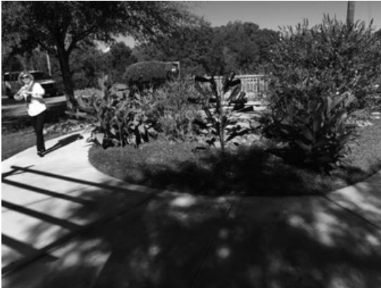
センサーガーデン

ンターにて「TEACHセンターの概要・就労部門概要・就労支援先視察」と濃密な時間を過ごしました。まず「カロライナファーム」ですが、ファームの敷地が39エーカーで、敷地内に3棟のグループホームがあります。1グループホームの定員は6名で、29歳から56歳までの18名の方がファームで暮らしています。敷地内にはグループホームの他にも植物を植えるグリーンハウス・アトデイサービス・スイミングプール・ウォークセラピー・乗馬セラピー・センソリーガーデンなどがあります。本人たちが豊かに暮らすためのセラピー的な活動やそのための設備の工夫が多く見られました。