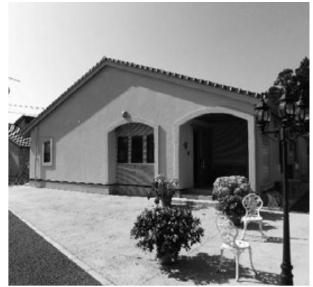
メゾン ドゥ コルザ 全景

の人らしい生活空間を整えてあげられることを実感しました。その他にも、衣類の管理を自分で行うことができるようになった方、自分の居室を自分で掃除をすることができるようになった方、他害行為や破損行為が頻発していた方が徐々に落ち着いて生活することができるようになる等、大きな変化を見ることができました。 生活を小さなユニットにすることで、個々に配慮した生活空間を整えること、十分なコミュニケーションが図れること、個別的な対応が行うことができること、生活の流れを自分のペースで過ごすことができること等、手厚い支援を実現し、一人ひとりが落ち着いて過ごすことができる、生活は変えることができる、と実感することができました。 ただ、計画に1年、生活しはじめて2年経過した後、千葉県の運営費補助事業として実施されたこの事業が、3カ年の有期限のものであったことから、全県的な事業として発展させることができなかったことが悔やまれます。 女性の方々で支援展開ができるのであれば、次は男性。しかし、前段で触れたように、県としての補助事業は打ち切りになってしまいました。しかし、県立施設を利用していただいている方々の中で、強度行動障害をお持ちの方を地域移行していただくための県のプロジェクトがあり、その事業に加わることとなりました。県立施設から2名と、しもふさ学園を