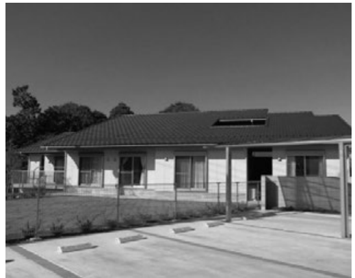
まなむすめホーム全景

「まなむすめホーム」は、平成25年度から千葉県の事業として行われた「強度行動障害のある方への支援体制構築事業」の一環として、強度行動障害の方をGHで支えるプロジェクトが進みました。当時、入所施設しもふさ学園の女性棟には9名の方々が生活されていましたが、そのうち6名が強度行動障害の判定を受けており、日々の生活を何とか無事に過ごすことが精一杯。新たなユニットを設け、より個別化された快適な生活空間が求められていました。このモデル事業にいち早く参画し、当時4名の利用者さんの地域生活へと踏み出していただくため準備がすすめられました。新たなGHの生活空間の工夫については、利用者さん一人ひとりに合わせた住まいを追求することで形になっていきました。平成15年から、徹底的に自閉症支援に特化した形で個々の配慮を行っていた入所施設のサテライト型である西館での成果をもとに、実際に入所施設で利用者さんを支援している職員からの意見を取り入れて設計されました。また、障害特性の配慮について、全国の先進的な取り組みを見聞した中で、それを加え、平成26年4月オープンの時を迎えました。