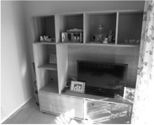
自分の好きなもので彩を

ことが日課となるほどでした。しかし、GHの居室づくりをしてきた時のこと、利用者さんらしく居室を彩ることができないかと親御さんと相談。「小さいころ、なんていったかしら。ミニチュアハウスのある、シルバニアファミリーが好きだったんです。」とご意見を伺い、テレビの上にはさりげなく飾ってみました。職員はみな、「ボンドで固定でもしなければ、またトイレに流されたり、外に投げられてしまうだろう」と予想していました。しかし、本人は捨てたり投げたりすることは無く、お部屋の一部として受け入れ、時折人形を手にとって並べ直すなど、楽しく過ごすことができていた様子が見えられました。強度行動障害であるから、すべてが刺激になってしまう、すべてが気になってしまうのではなく、本人の生活の一部として機能させれば、本人の生活は彩られ、そ