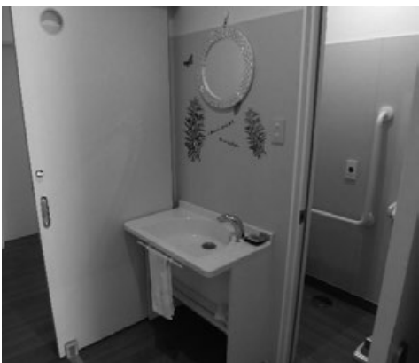
全居室に、トイレと洗面台

男性のGHと女性のGHでの大きな違いは、一人ひとりの生活スペースを見直し、全居室に寝室・リビングに加え、トイレと洗面台を設けたことです。なぜ、トイレがそれぞれの居室に必要になったのか。それは、二つの理由があります。一つは、障害特性からトイレに1時間以上の時間がかかったり、他の方がいらつしゃると排泄がうまくできない方がいらつしゃいます。生活する方々が、自分のスペースで生活するために、自分のスペースとして