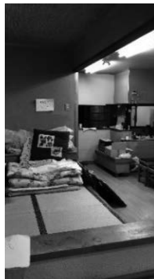
(無償で借りることができた建物)

現在、グループホームの12人と施設入所の21人(その後、県内複数の他施設が短期入所での受け入れ行つてくれて、半数近くまで減つたということですが)が避難生活を強いられているところです。グループホームの方々は、川越市内の高齢者デイサービス事業所が事業廃止した後の建物を運よく無償で借りることができ、そこで合宿所のような生活を